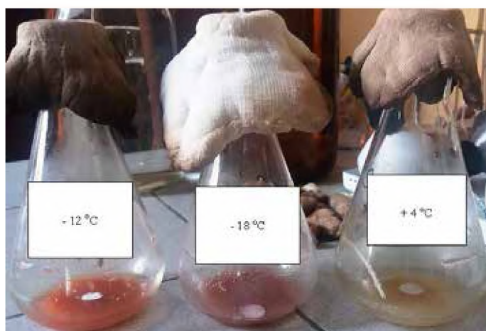
Рис. 1. Штамм Streptomyces violaceus VKPM Ac-1734 культуральная жидкость; 120 ч культивирования конидий, хранившихся при температуре минус 12 °С, минус 18 °С, плюс 4 °С в течение 30 дней

Исследуемые штаммы являются пигментообразующими. При изучении изменчивости культур стрептомицетов отмечено, что при выращивании на агаровых средах изменяется цвет воздушного мицелия, цвет субстратного мицелия остается практически без изменений. После первого пассажа на агаровую среду пигмент воздушного мицелия имел белый с сероватым оттенком цвет для обоих исследуемых штаммов, а субстратный — светло-желтый для Streptomyces lucensis VKPM Ac-1743, розовый — для Streptomyces violaceus VKPM Ac-1734, светло-коричневый для других культур (Рис. 1). В течение семи суток культивирования на агаровой среде интенсивность пигментации у штаммов усилилась, что свидетельствует об активизации биохимических процессов, связанных с адаптацией культур в стрессовых ситуациях. После хранения культур при низких температурах минус 12 °С и минус 18 °С в течение 30 дней наблюдалось более интенсивное пигментообразование (Рис. 1). Возможно, воздействие экстремальных температур приводит к частичной деструкции белков, продукты которой являются субстратом для тирозиназы, катализирующей окисление фенолов (например, тирозина) и катализирующей синтез меланина и других пигментов из их предшественника тиро-