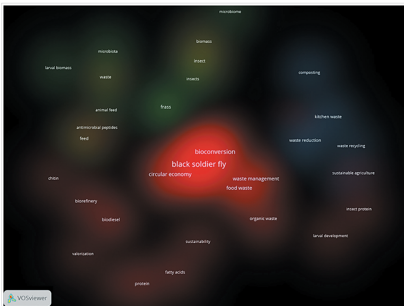
Рисунок 4. Карта плотности мирового исследовательского поля Hermetia illucens в разрезе тематических кластеров Figure 4. Cluster density map of the Hermetia illucens world research field by thematic clusters